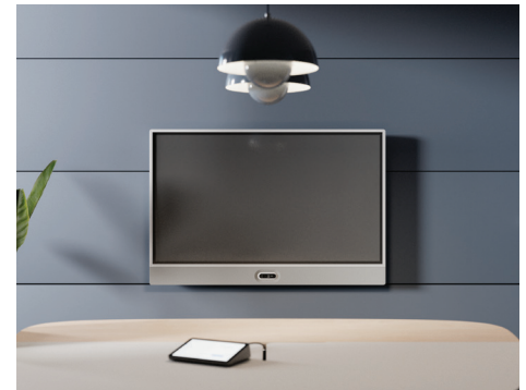
Wandhalterung mit Kamera unten

Das flexible Rally Board 65 ist perfekt für Ihre Meetings. Es funktioniert nahtlos mit führenden Plattformen wie Microsoft Teams, Zoom und Google Meet* in Android, PC oder BYOD-Modus, sodass Sie Rally Board 65 problemlos an aktuelle und zukünftige Anforderungen anpassen können. Außerdem bietet es mehrere Montagemöglichkeiten**, sodass Sie es in jedem offenen Raum oder Konferenzraum verwenden können. Es ist so konzipiert, dass die Kamera über oder unter dem Bildschirm angebracht werden kann, damit alle Teilnehmer in allen Räumen natürlichen Blickkontakt halten können.