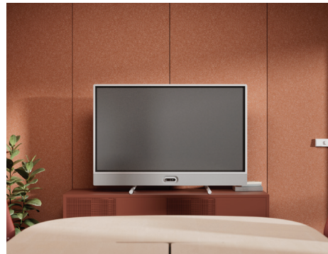
Tischstativ mit Kamera unten