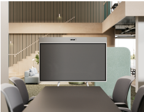
Wagen mit Kamera oben